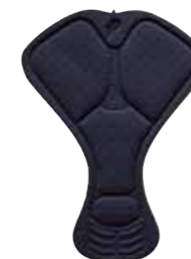
TRIATLON PAD WOMEN

– TIL ENTUSIASTER, SOM ELSKER DERES SPORT C2 er også zone inddelt, så den er tykkere på selve siddepuden og blød ud mod vingerne – skummet er en anelse tykkere for at give ekstra komfort. Skummet har en fremragende elasticitet, og det holder styrke og egenskaber i rigtig lang tid. Også efter mange vaske.