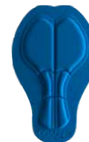
INFINITE C3 PAD MEN