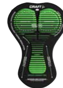
INFINITE C1 PAD WOMEN