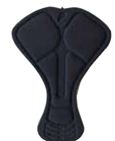
TRIATLON PAD MEN