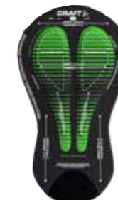
INFINITE C1 PAD MEN