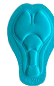
INFINITE C3 PAD WOMEN

– UDVIKLET I SAMARBEJDE MED ORICA-GREENEDGE Puden, som giver den funktionalitet og den komfort, som en toppræstation kræver. Den er skabt til elite atleter, som bruger mange timer på cyklen og som ikke går på kompromis. Puden er opdelt i zoner, som nøje følger kroppen. Vi har brugt den nyeste teknologi indenfor laserskårte puder – den patenterede "FOAM CUTTING TECHNOLOGY".