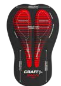
INFINITE C2 PAD MEN