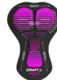
INFINITE C2 PAD WOMEN